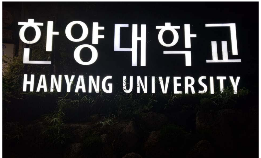
Hanyang University, Seoul (Südkorea)